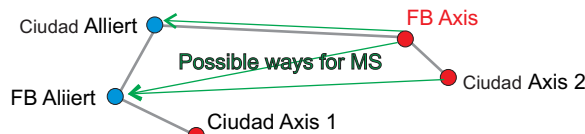
presionas V (deploy) para colocar el MS

Tercero, presionas V (deploy) para colocar el MS, el cual debe estar entre 400-1400 metros de una instalación enemiga para la ciudad o fb